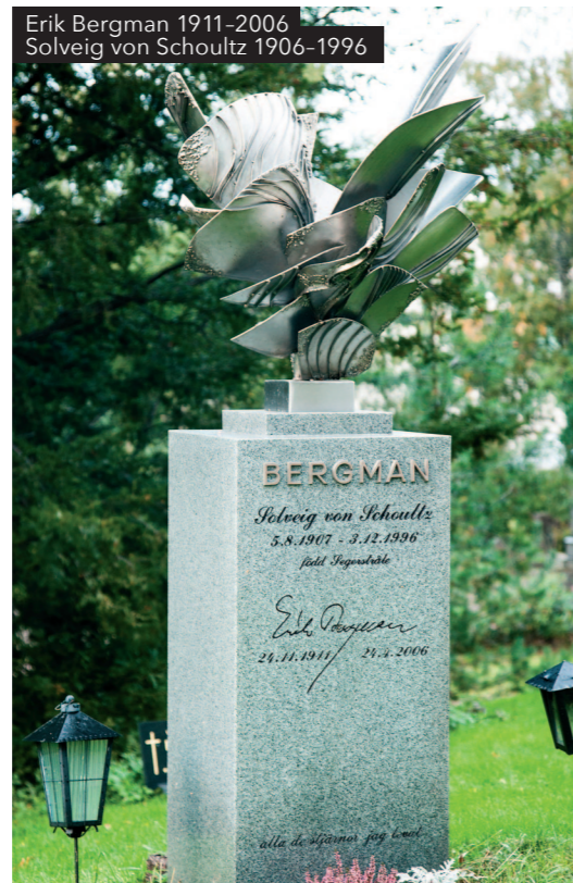
Erik Bergman 1911-2006 Solveig von Schoultz 1906-1996