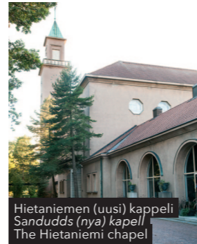
Hietaniemen (uusi) kappeli Sandudds (nya) kapell The Hietaniemi chapel