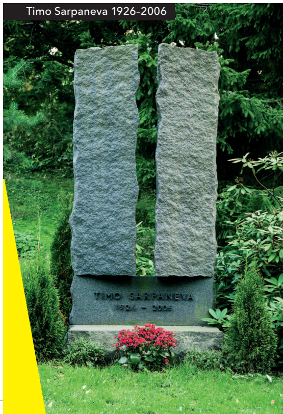
Timo Sarpaneva 1926-2006