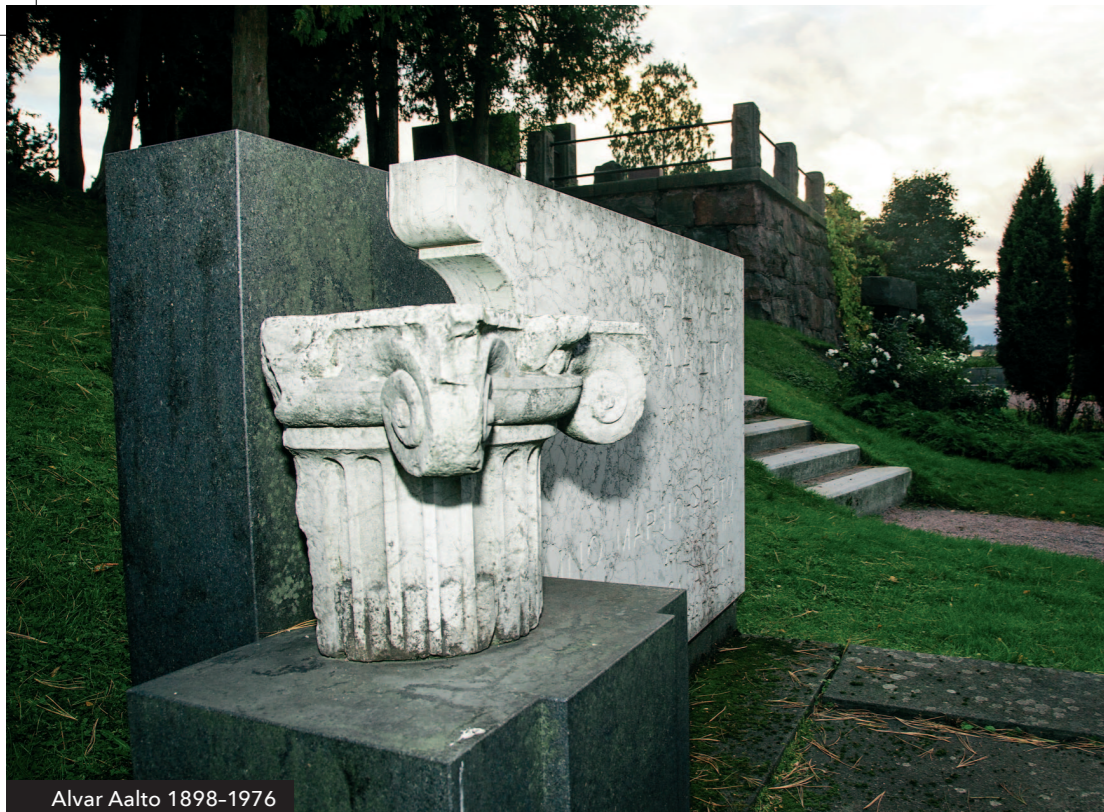
Alvar Aalto 1898-1976