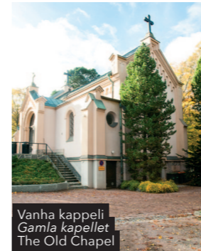
Vanha kappeli Gamla kapellet The Old Chapel